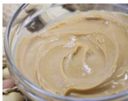
オートバター (フィリング)